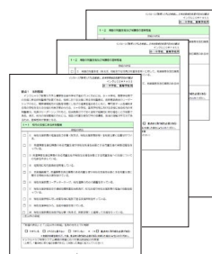
チェックを行うシート