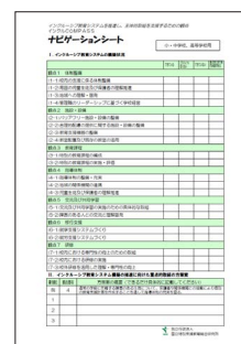
ナビゲーションシート